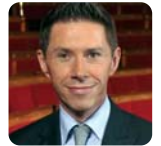
Pierre Yves Le Borgn'

Konrad Adenauer , Vorsitzender der "Amis de l'Institut Français" Wäre Konrad Adenauer heute glücklich mit den deutsch-französischen Beziehungen?